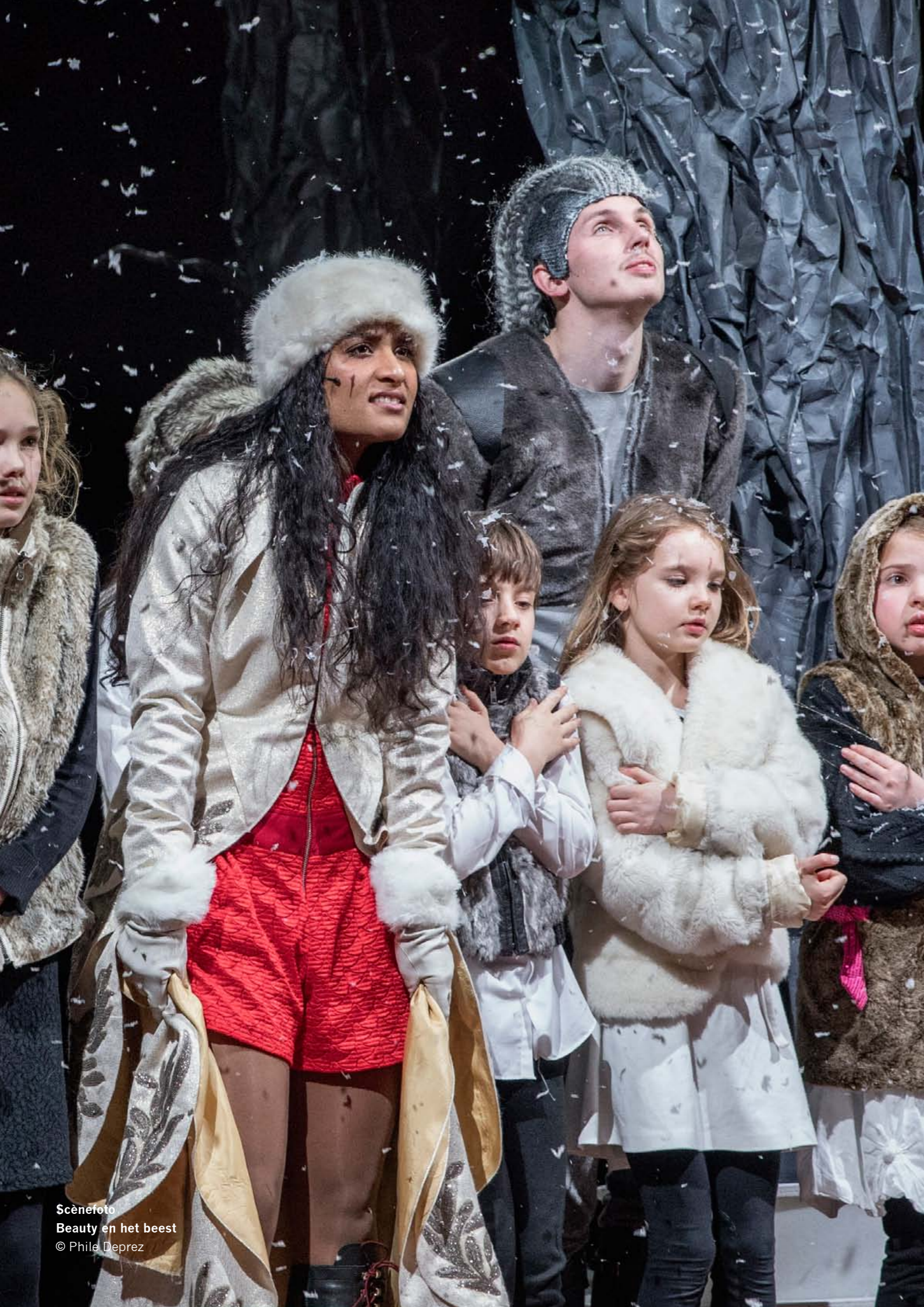
Scènefoto Beauty en het beest