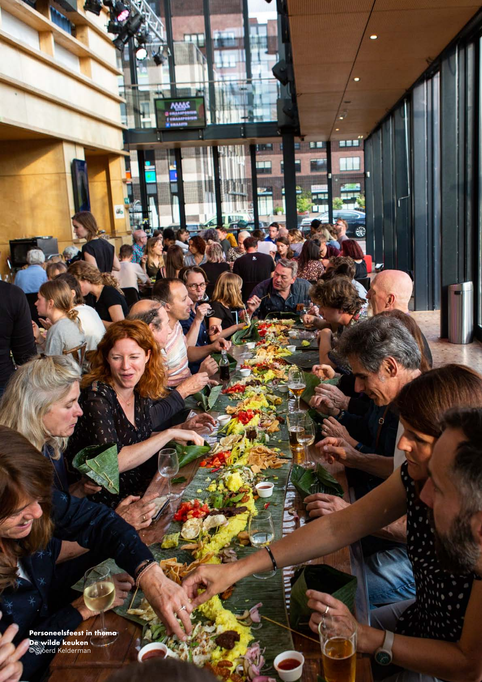
Personeelsfeest in thema De wilde keuken