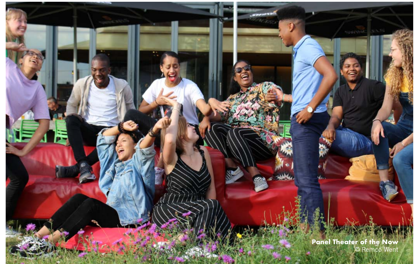
Panel Theater of the Now